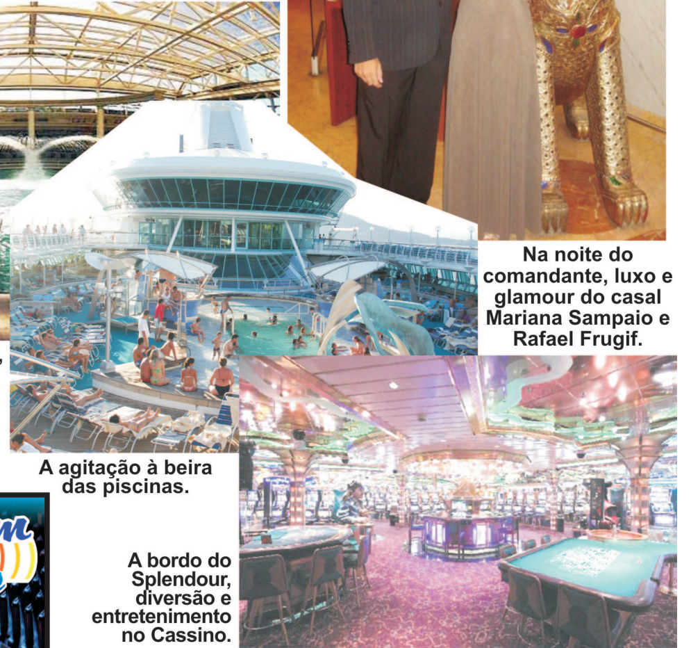
A agitação à beira das piscinas.