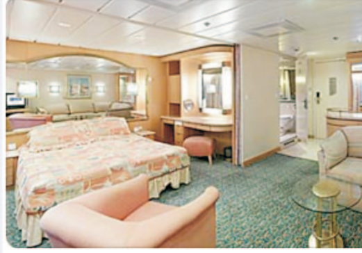
Suítes luxuosas compõem o requinte e sofisticação do Splendour Of The Seas.