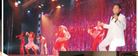
Espectáculos diários no teatro principal, no melhor estilo Broadway.