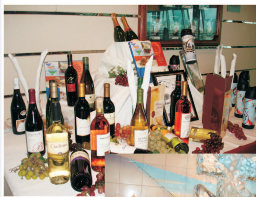
Momento Gastronômico: O melhor da culinária internacional no Splendour Of The Seas.