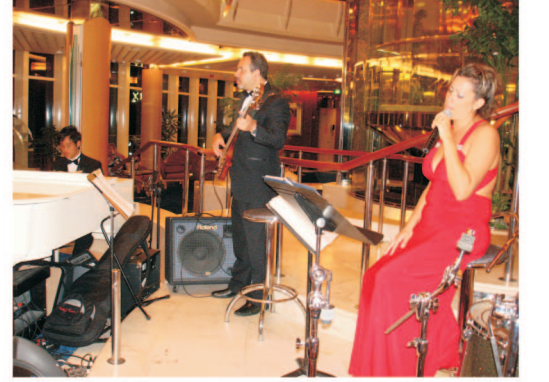
Piano Bar e o melhor da MPB e do cancionero italiano.