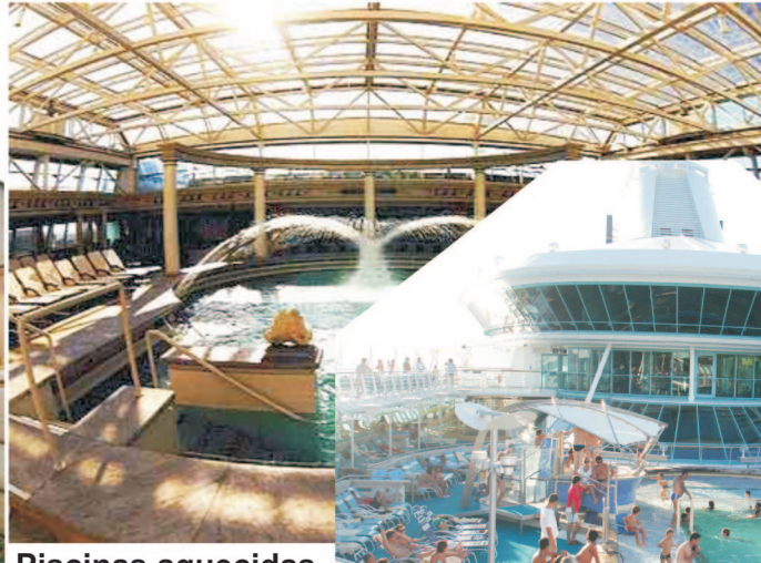
Piscinas aquecidas, cobertas.